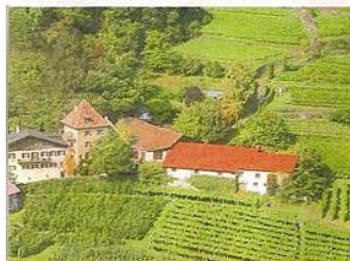
Hübscher Hof: „Köfelgut“. Kräuterparadies: „Pflegerhof“.

Die Inhaber des entlegenen Berggehöfts haben sich dem Anbau und Verkauf heimischer und allgemein verbreiteter Kräuter verschrieben. In einem kleinen