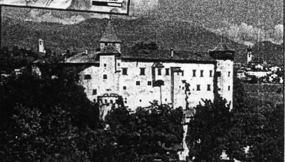
Auf Schloss Prösel in Völs fand von 1506 bis 1510 Tirols erster Hexenprozess statt

Rast machen, abschalten, die Natur genießen. Ein Fußbad im Gebirgsbach, eine Schwitzkur am Berghang, eine Genuss tour im Fels – das alles ist Urlaub auf der Seiser Alm in Südtirol.