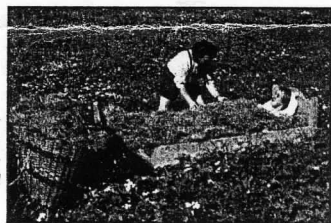
Rechts: Die entspannende Wirkung eines Heubades ist enorm