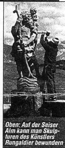
Oben: Auf der Seiser Alm kann man Skulpturen des Künstlers Rungaldier bewundern